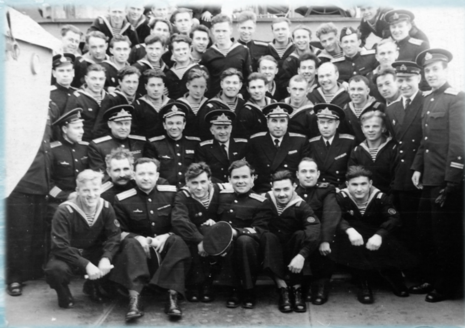
Главком ВМФ адмирал ГОРШКОВ С.Г. с экипажем К-3 после подъема флага. Северодвинск. 1 июля 1958 года