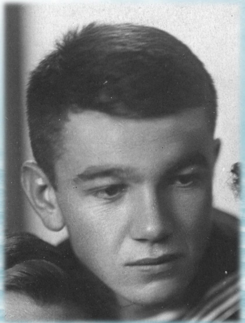
Курсант военно-морского училища имени Фрунзе