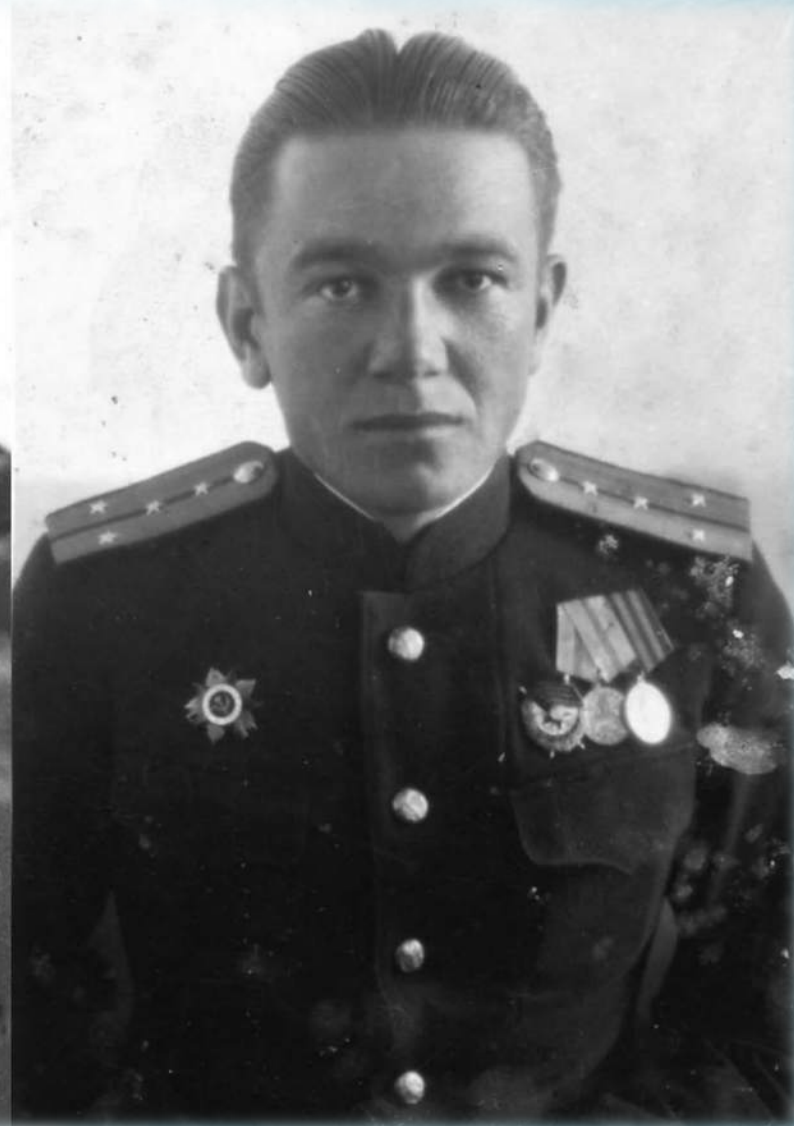
Командир артиллерийско-торпедной боевой части подводной лодки Щ-202