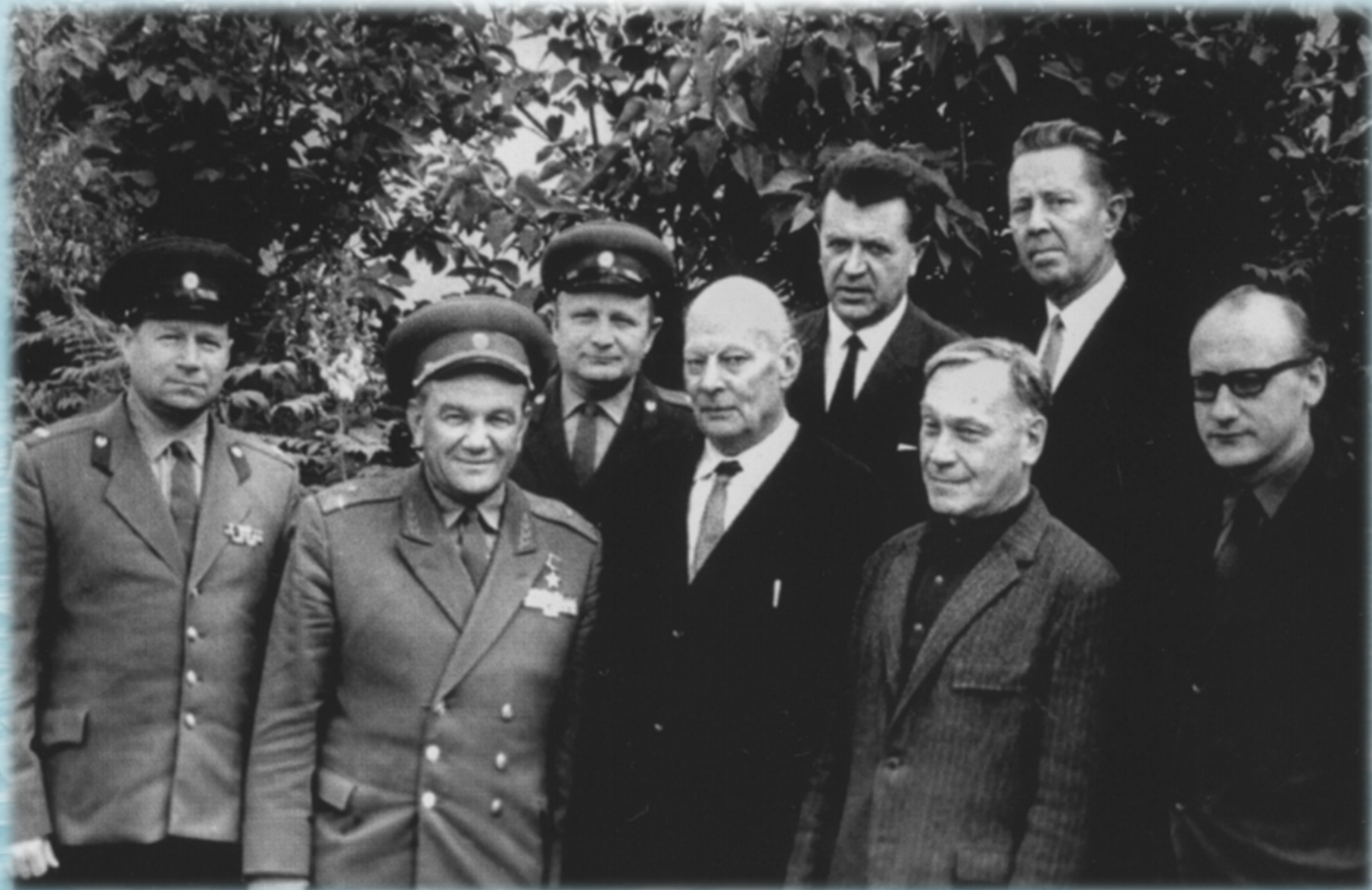
Обнинск, август 1968 года