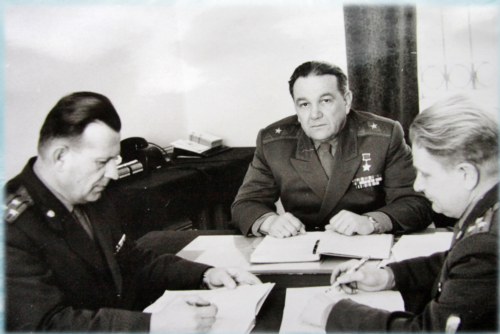
Начальник учебного центра в своем рабочем кабинете. Обнинск, 1973 год