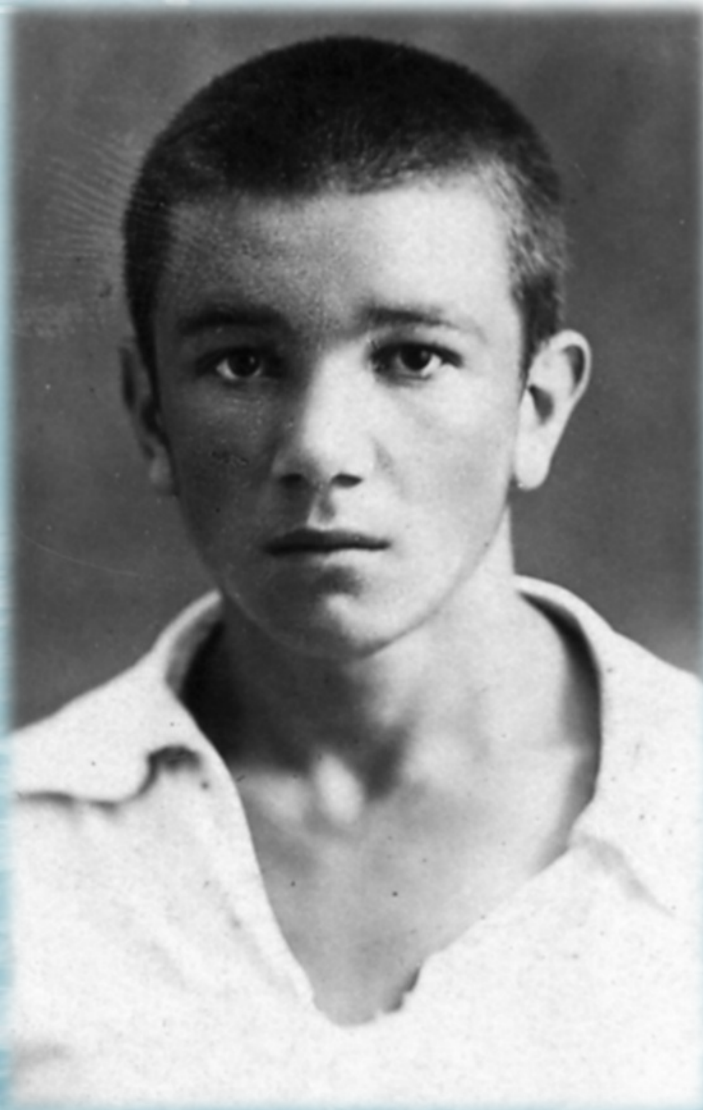
Студент Новочеркасского индустриального института