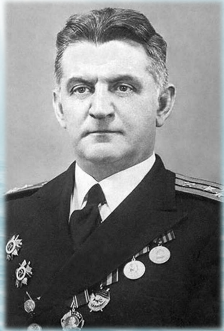
Главный конструктор подводной лодки К-3 ПЕРЕГУДОВ Владимир Николаевич