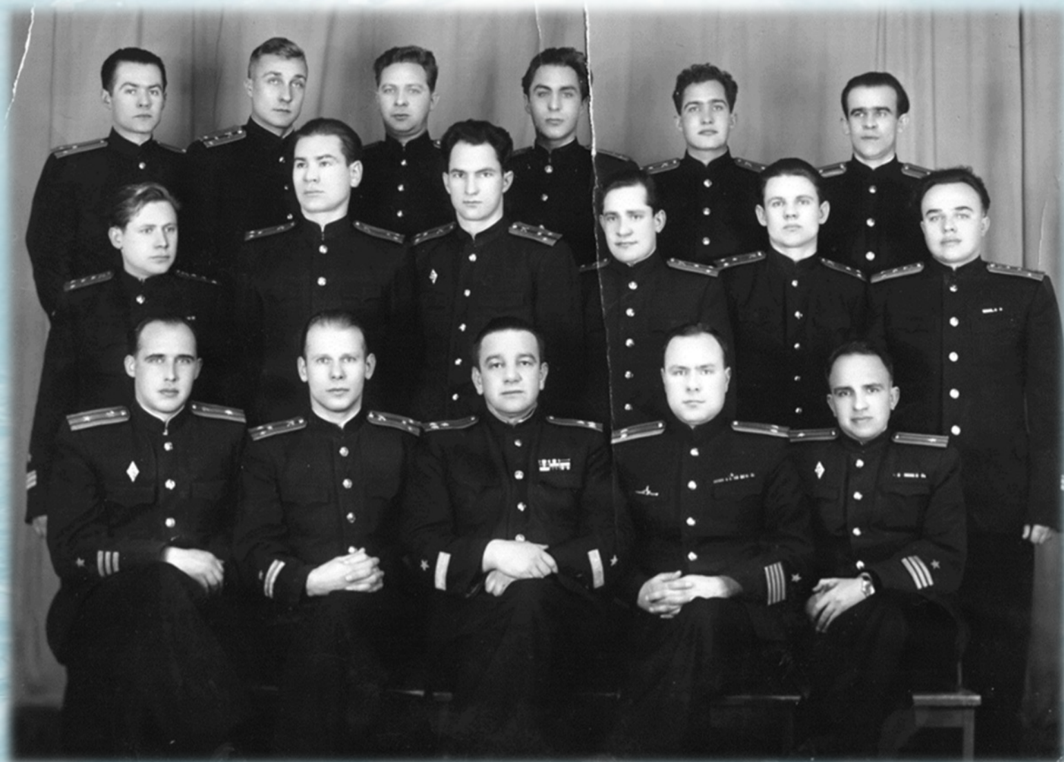
Капитан 1 ранга ОСИПЕНКО Л.Г. (средний в нижнем ряду) с офицерами двух первых атомных подводных лодок. Обнинск, 1957 год